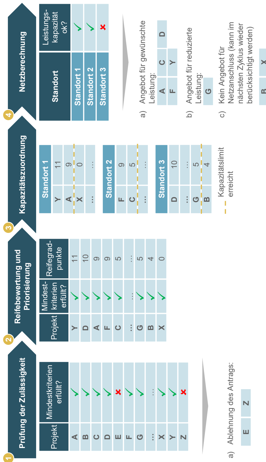
Abbildung 2: Die vier Schritte der Clusterstudie mit reifegradbasierter Priorisierung