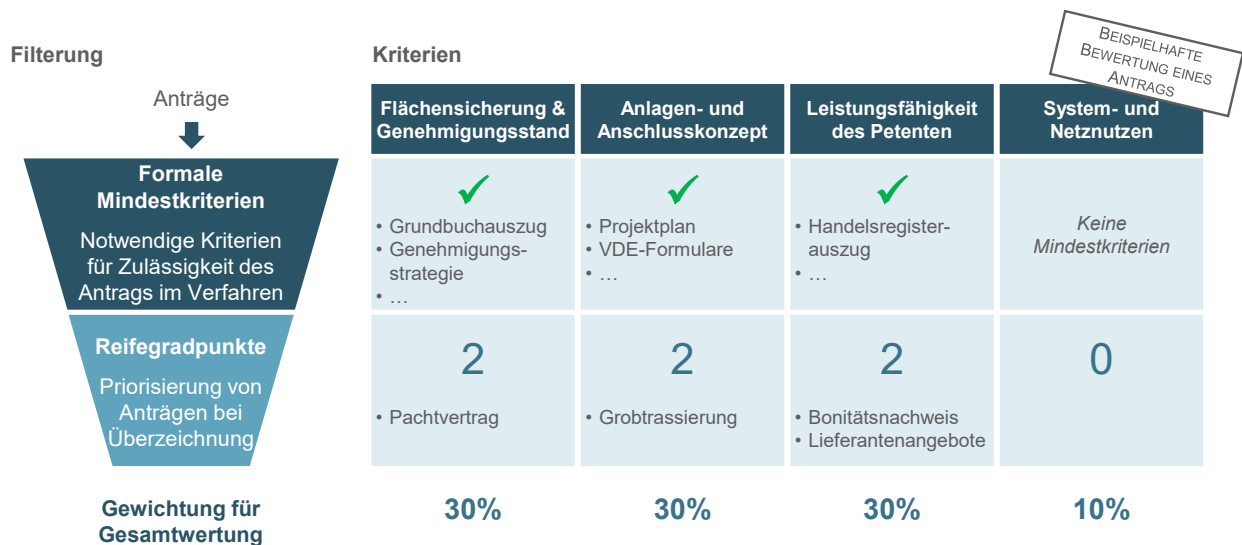
Abbildung 3: Prinzip der Bewertungsmethodik nach Mindestanforderungen und Reifegradpunkten mit beispielhaften Ausprägungen